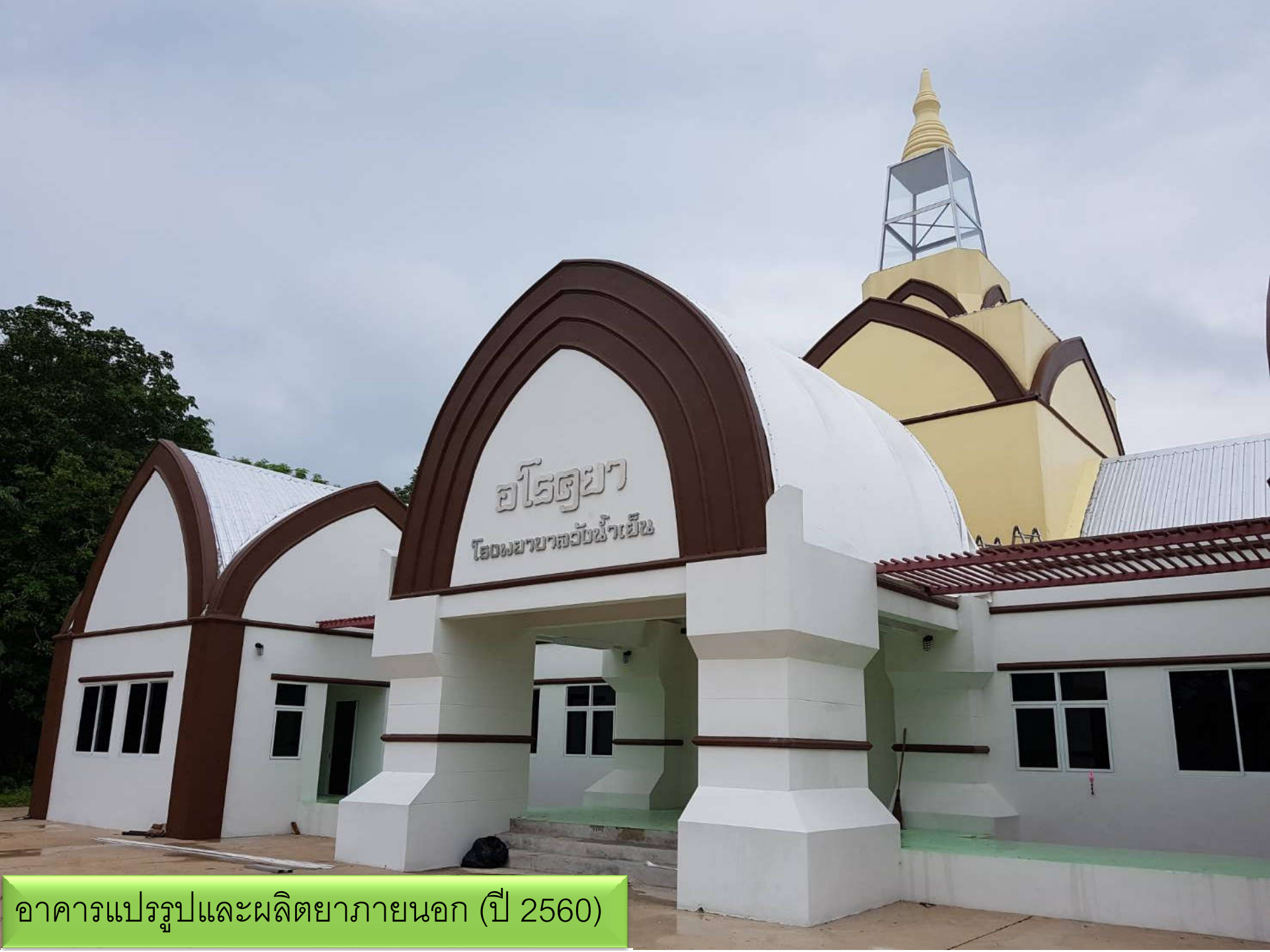
อาคารแปรรูปและผลิตยาภายนอก (ปี 2560)