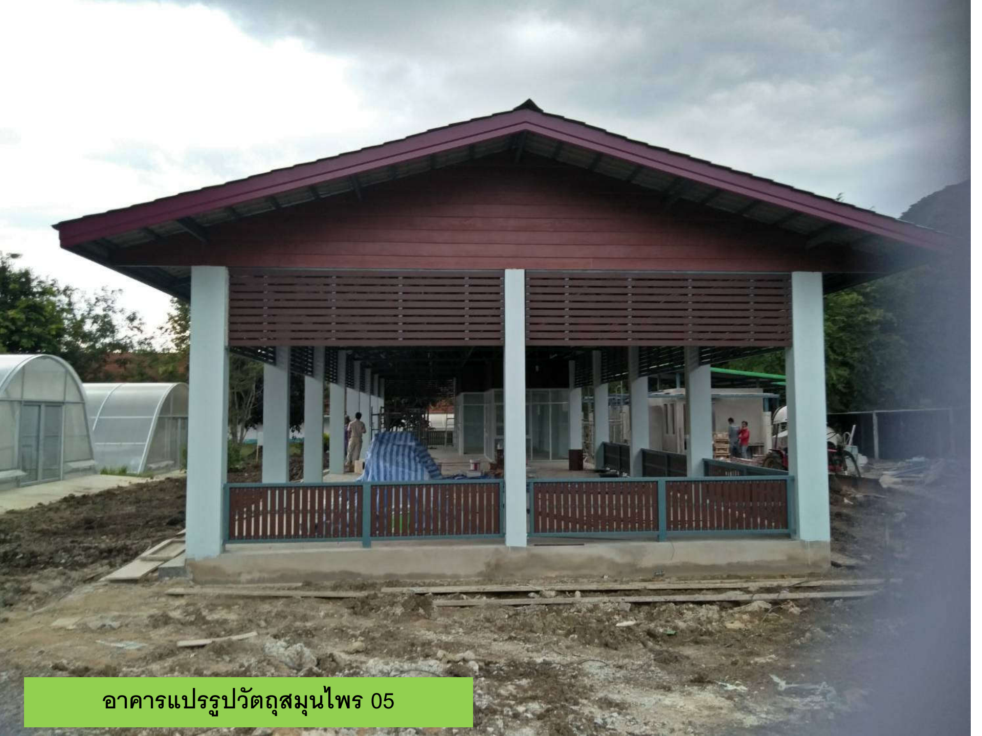
อาคารแปรรูปวัตถุดิบไผ่ 05