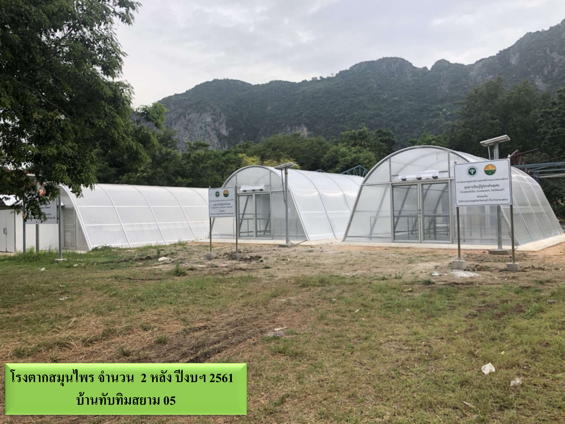
โรงตากสมุนไพร จำนวน 2 หลัง ปีงบประมาณ 2561 บ้านทับทิมสยาม 05