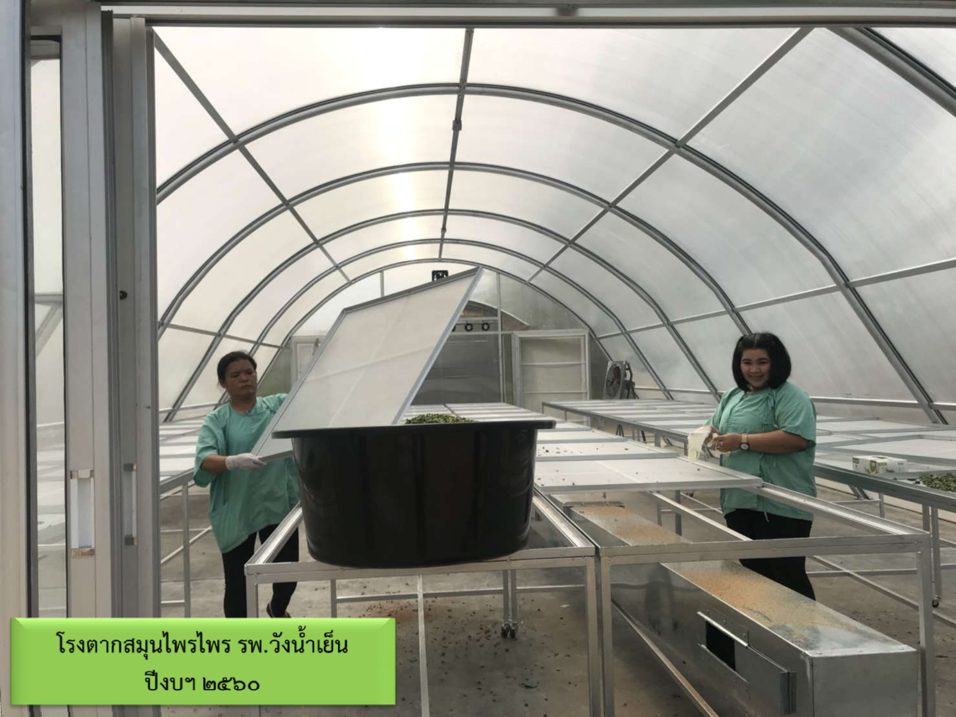
โรงตากสมุนไพร รพ.วังน้ำเย็น ปีงบ๑ ๒๕๖๐