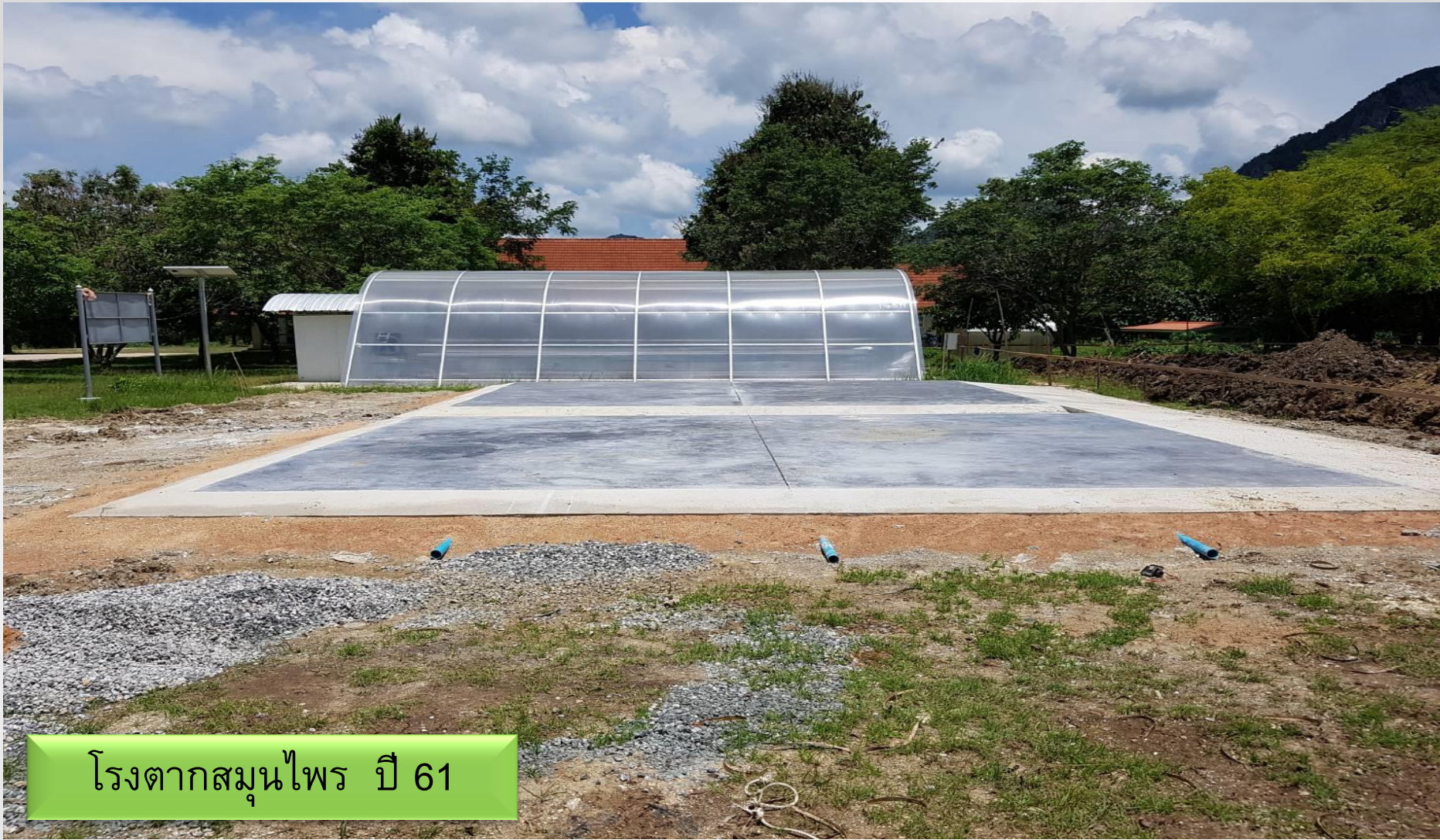
โรงตากสมุนไพร ปี 61