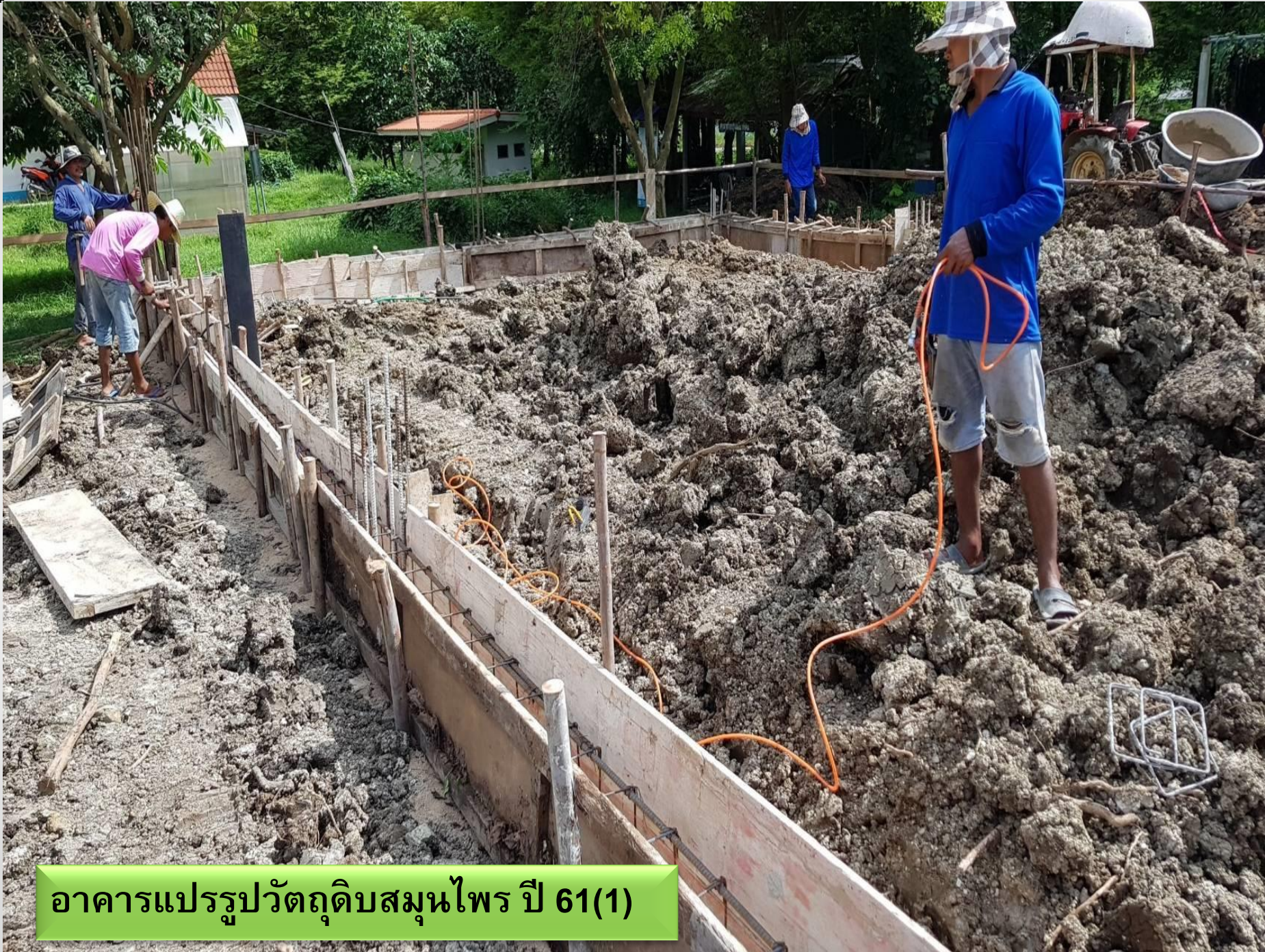
อาคารแปรรูปวัตถุดิบสมุนไพร ปี 61(1)