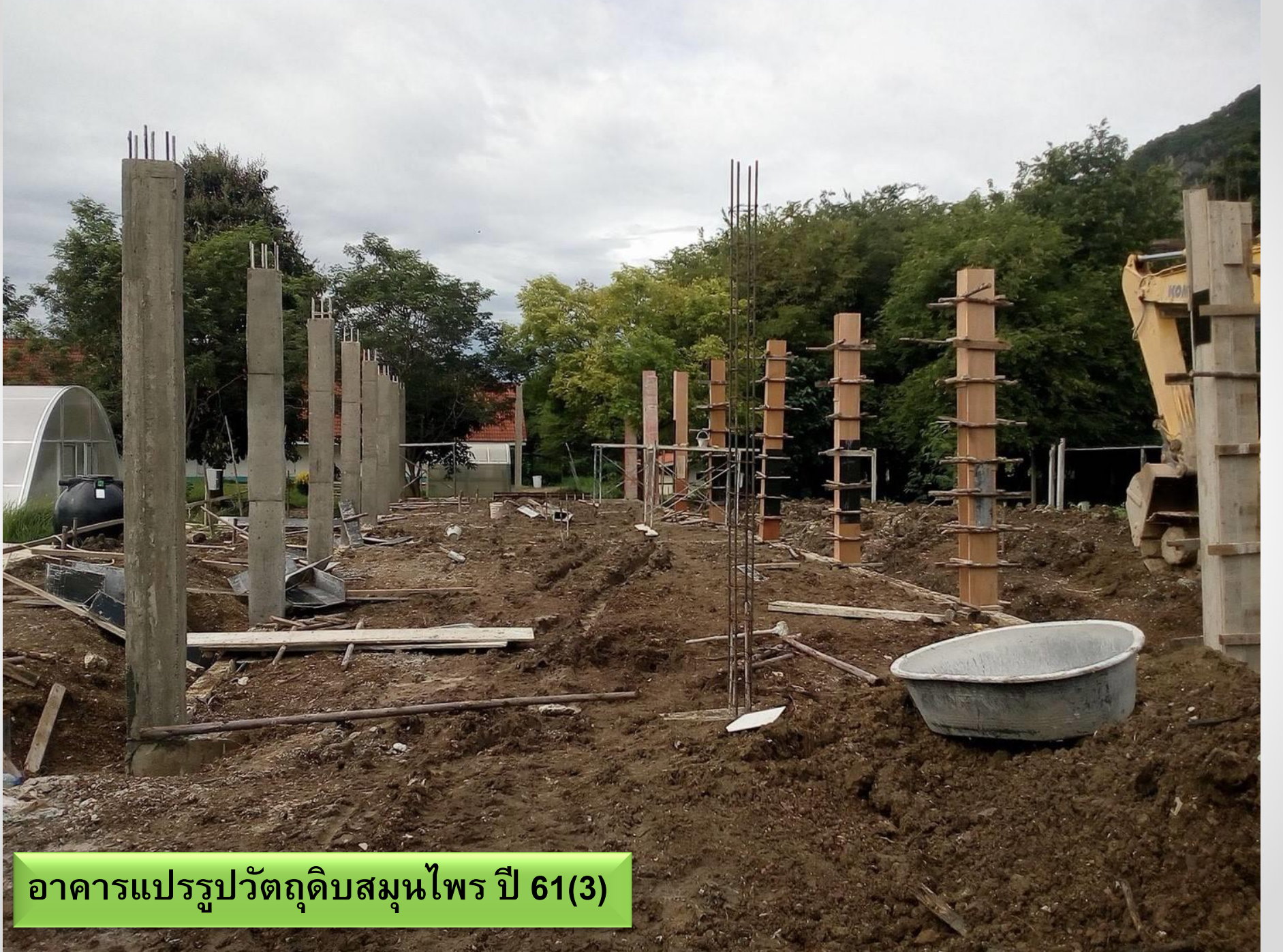
อาคารแปรรูปวัตถุดิบสมุนไพร ปี 61(3)