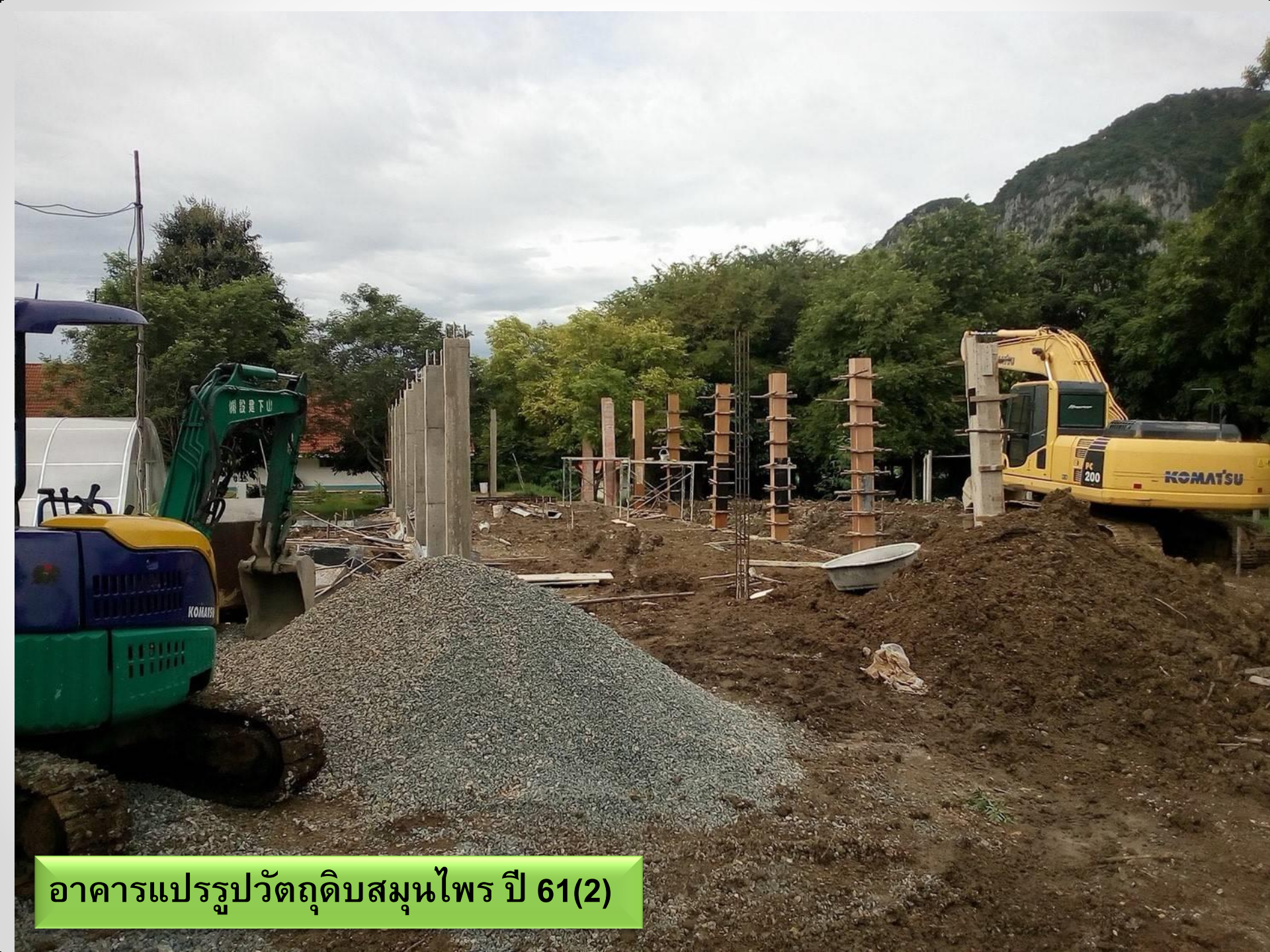
อาคารแปรรูปวัสดุบสมุนไพรร ปี 61(2)