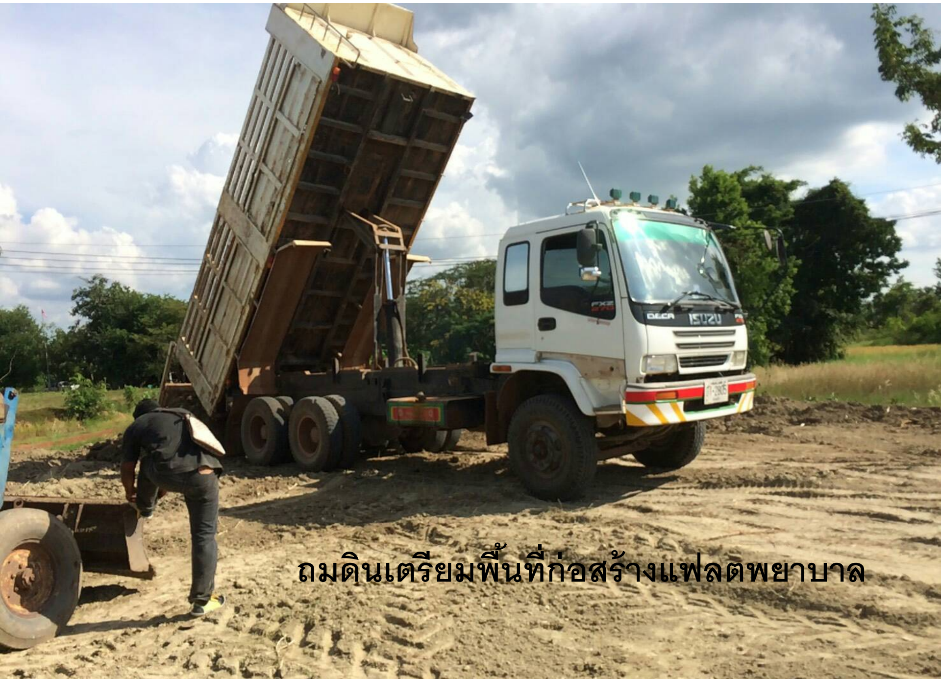
ถมดินเตรียมพื้นที่ก่อสร้างแฟลตพยาบาล