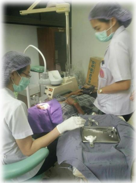
ทำฟันปลอมแก่ผู้ป่วยมะเร็งระยะสุดท้าย