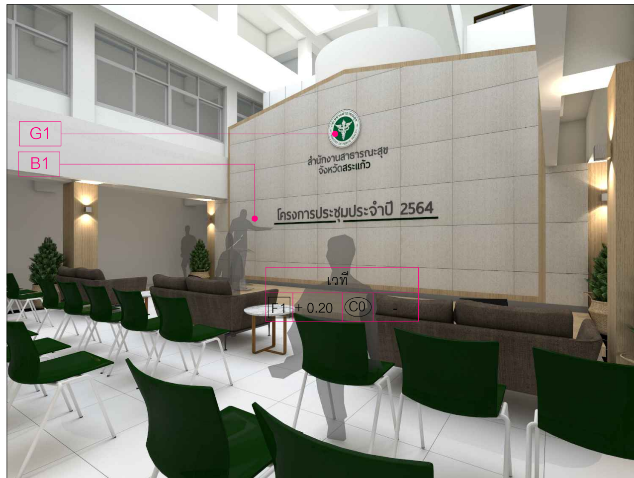
ภาพสามมิติส่วนโถงด้านใน/เวที