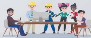
สถานประกอบการก้าวไกล ต้องใส่ใจสุขภาพแรงงานต่างชาติ Happy and Healthy Foreigner Worker