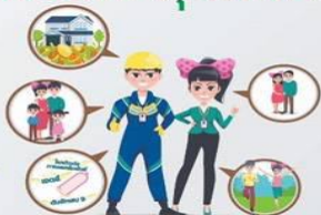
ครอบครัวสดใส ใส่ใจดูแล Smart and Healthy family