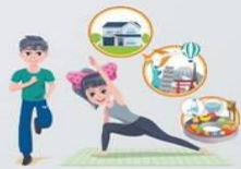
เตรียมเกษียณอย่างมีคุณภาพ พาว์ชาวยืนยาว Preretirement and Longevity Planning