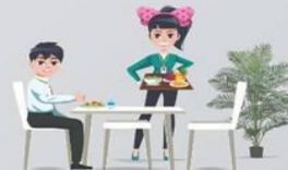
โรงอาหารปลอดภัย ใส่ใจสุขภาพ Healthy Canteen