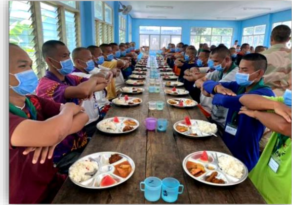
แยกภาชนะรับประทานอาหาร แก้วน้ำ