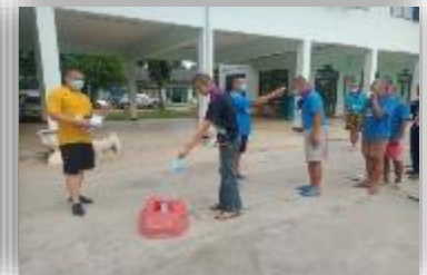
แยกขยะทั่วไปใส่ถุงสีดำและขยะ ปนเปื้อนสารคัดหลั่งใส่ถุงสีแดง