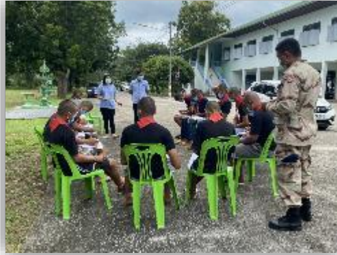
เว้นระยะระหว่างบุคคลในการเข้ากลุ่ม