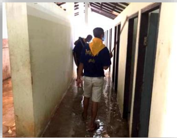
พ่นยาฆ่าเชื้อห้องนอน ห้องน้ำ ห้องประชุม อุปกรณ์ โຕ้ะ เก้าอี้