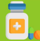
รายละเอียดผลการดำเนินงาน รพ.ที่มีระบบจัดการ AMR อย่างบูรณาการ